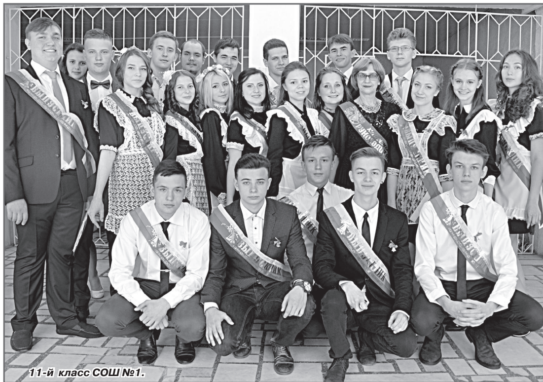
11-й класс СОШ №1.

В. СКАРГА. Е. РОМАНЕНКОВА. Фото авторов.