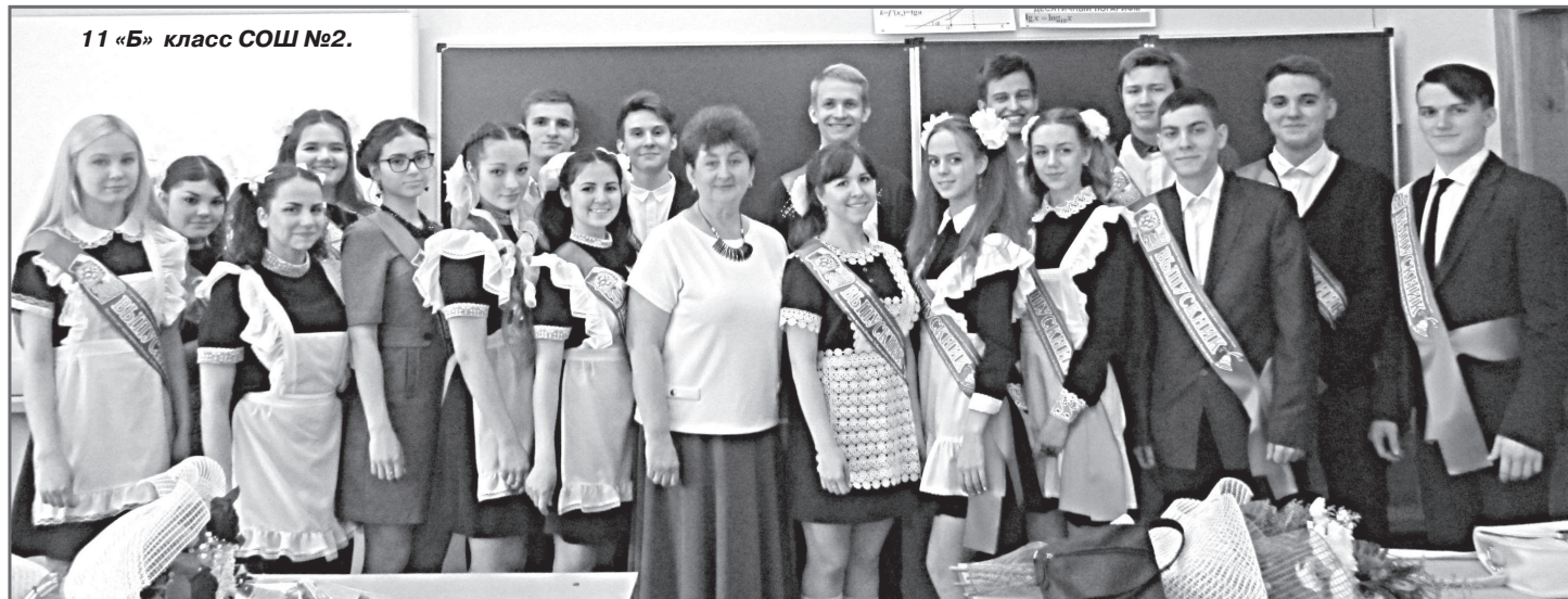
11 «Б» класс СОШ №2.