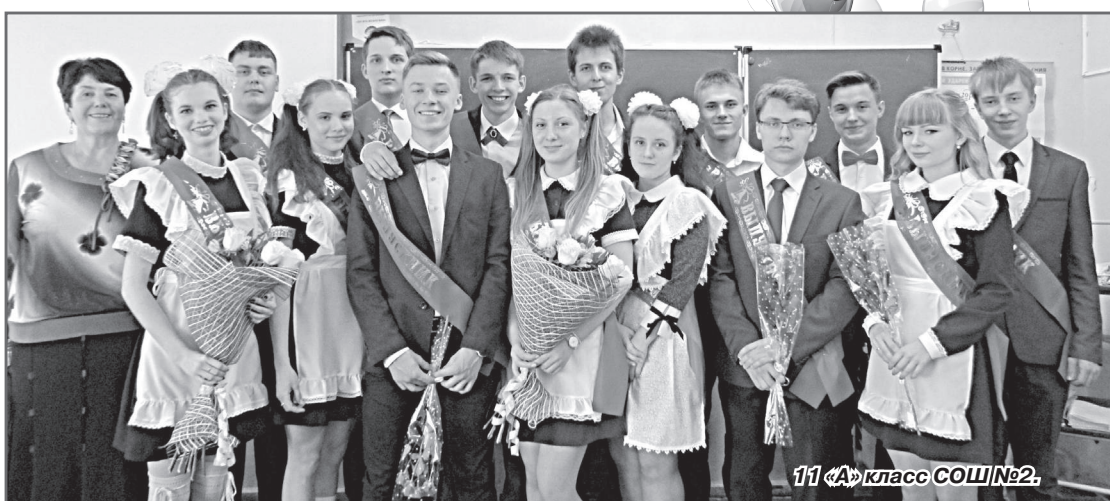
11 «А» класс СОШ №2.